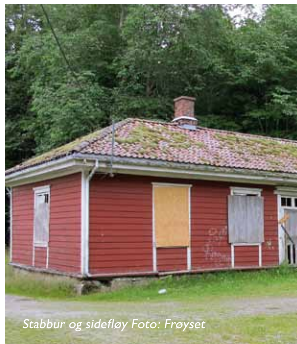
Stabbur og sidefløy