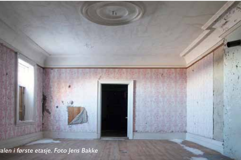
Salen i første etasje.