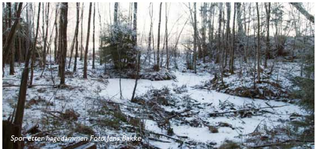
Spor etter hagedammen