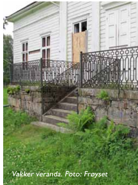
Vakker veranda.