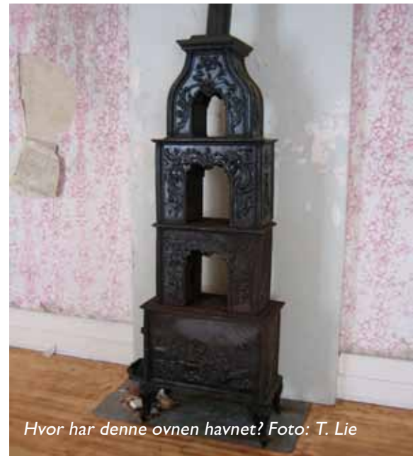
Hvor har denne ovnen havnet?