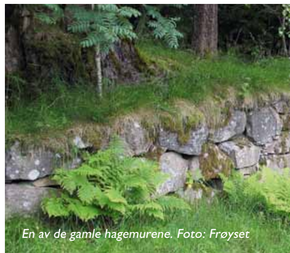
En av de gamle hagemurene.