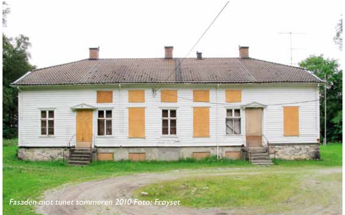
Fasaden mot tunet sommeren 2010